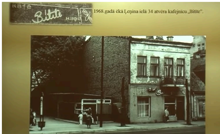
2. attēls. Kafejnīca “Bitīte” tās sākuma posmā.

“Bitītes” stāsts aizsākās 1968.gada novembrī. Ēka Ļeņina ielā 34 (tā tolaik sauca tagadējo Kuldīgas ielu Ventspilī) pirms tam ventspilniekiem bija zināma kā vieta, kur pulcējās grāmatu cienītāji, jo tur atradās grāmatnīca “Gaisma”.