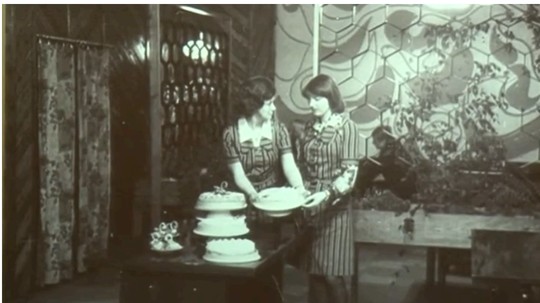
3.attēls. Kafējnīcas “Bitīte” interjers un tortes.

Samērā plašs bija piedāvāto konditorejas izstrādājumu piedāvājums. Te tirgoja gan dažādas bulciņas un kūciņas, gan varēja iegādāties tortes un kūkas svētku reizēm. Ventspilnieki bija iecienījuši šeit nopērkamās kūkas, piemēram, “Dzintara sakta”, “Mokka”, “Pasaka”, “Pārsla”.