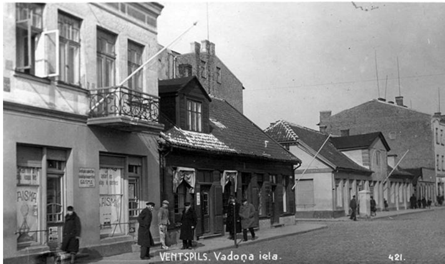
1. attēls. Grāmatnīcas “Gaisma” ēka 1930.gadu beigās. Ēkā vēlāk, 1960.gadu beigās, iekārtos kafejnīcu “Bitīte”.

“Bitītes” stāsts aizsākās 1968.gada novembrī. Ēka Ļeņina ielā 34 (tā tolaik sauca tagadējo Kuldīgas ielu Ventspilī) pirms tam ventspilniekiem bija zināma kā vieta, kur pulcējās grāmatu cienītāji, jo tur atradās grāmatnīca “Gaisma”.