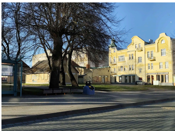
4. attēls. Kafejnīcas “Bitīte” vieta šobrīd, 2025.gada martā.