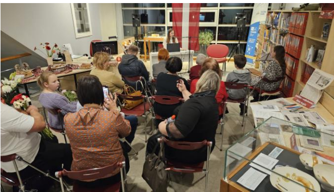
Rīgas Centrālās bibliotēkas izstāde "100 grāmatas bērniem"