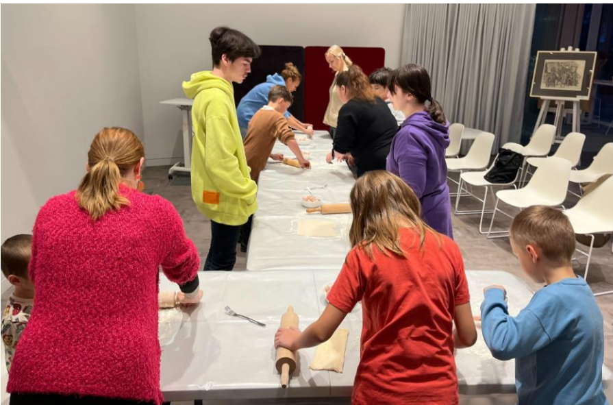
BJVŽ 9+ nodarbība Ventspils 1.pamatskolas 2.a klasei