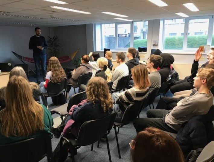
IT fakultātes studentu tikšanās ar SIA "Azeron" un "Airvalent" pārstāvjiem