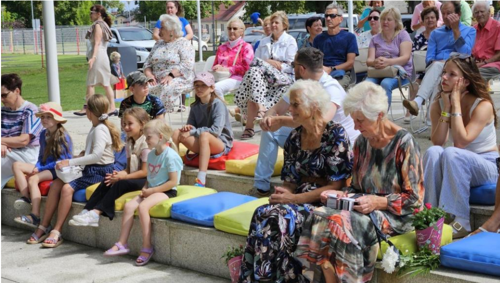
Kopprojekta ®adīts Gāļiņciemam koku ietērpu izstāde