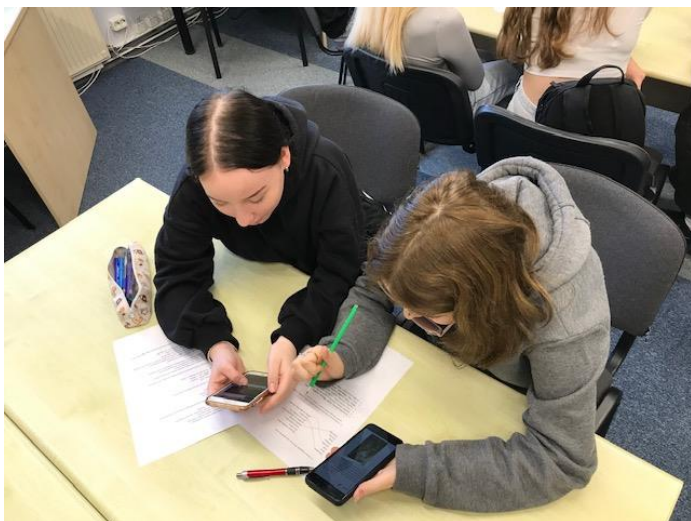
Punktiņu mandalu darbnīca

Ventspils 2. pamatskolas 9.a klases viesošanās VeA bibliotēkā, veicot praktiskos uzdevumus