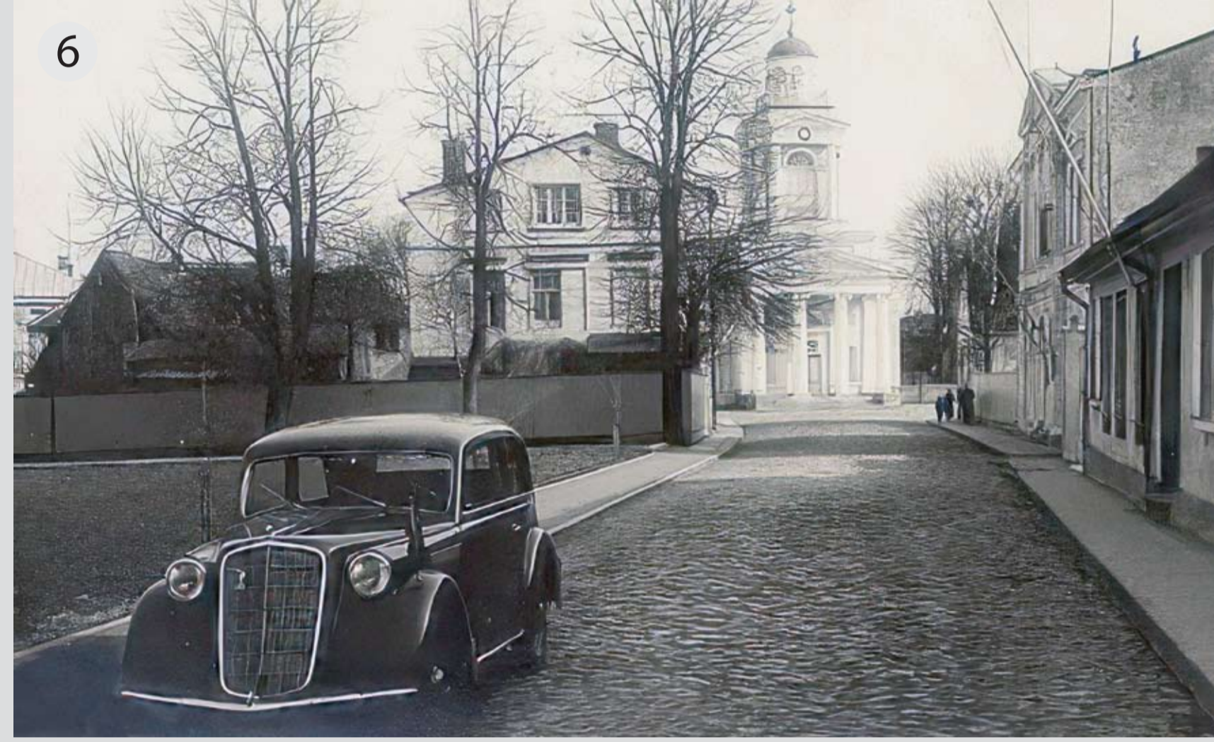
1933. gadā lasītāji, kuri nēma grāmatas uz mājām, katru mēnesi maksāja 20-40 santimus. No lasītāju iekasēm gada ieņēmumi bija 1579 latu un 45 santimi