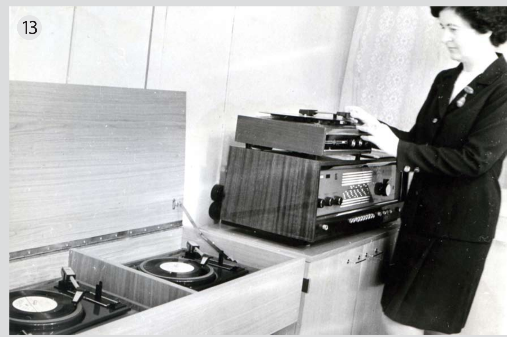
Mūzikas un nošu literatūras lasītava bija klavieres, stereoskaņotājs, kā arī divas skaņuplašu klausīšanās kabīnes

Lielu atsaucību guva bibliotēkas organizētās tikšanās pie kamina. Degot svecem, sprāksnot kamina bērzu šķīlām, risinājās sarunas ar bibliotēkas lasītājiem tuvākā lokā par grāmatu, par lasīšanu, par mūziku