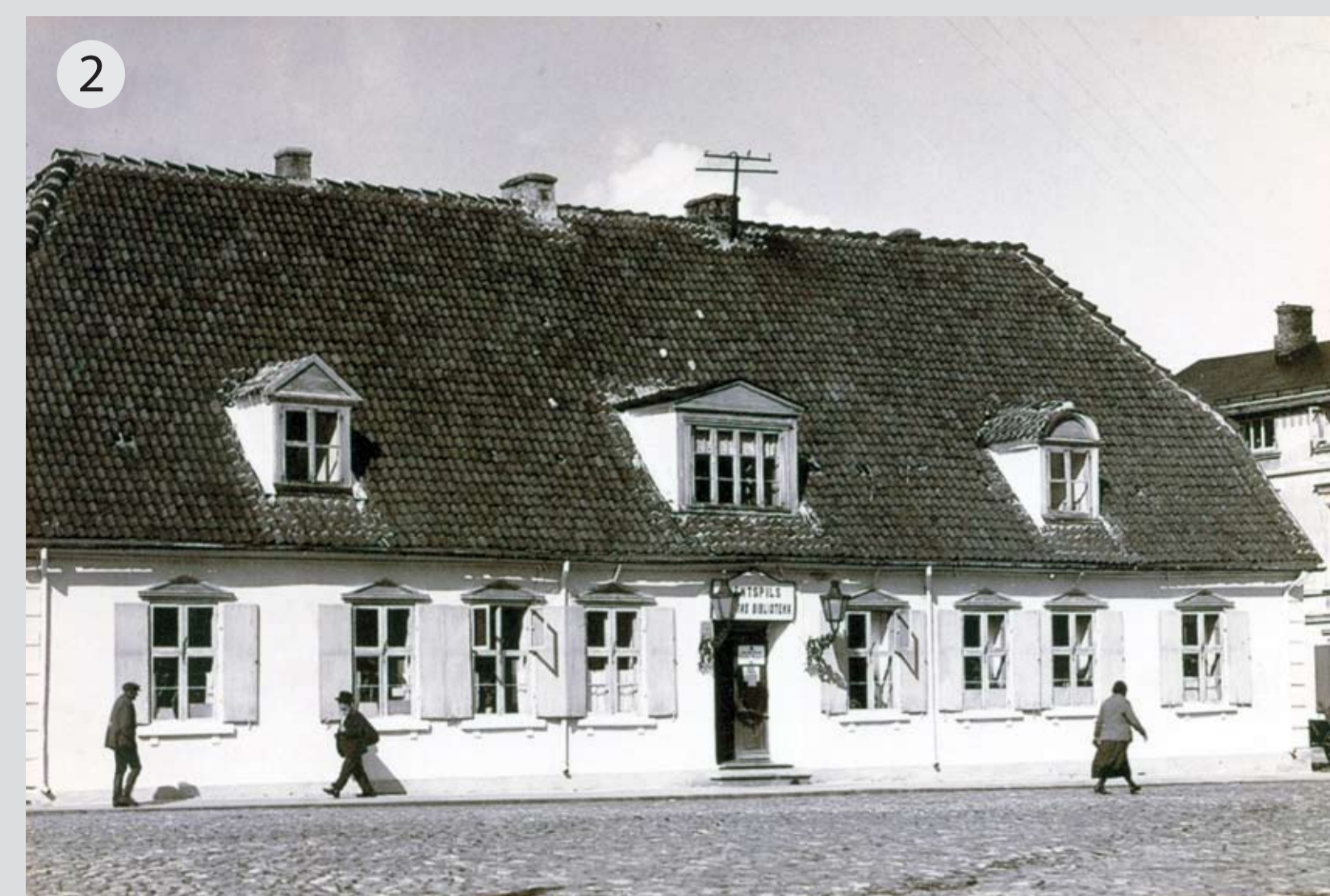
Grāmatas bibliotēkā izsniedza par maksu. Pirmajā darbības gadā lasītājiem tika izsniegtas 4200 grāmatas, iekasējot 3540 rubļus