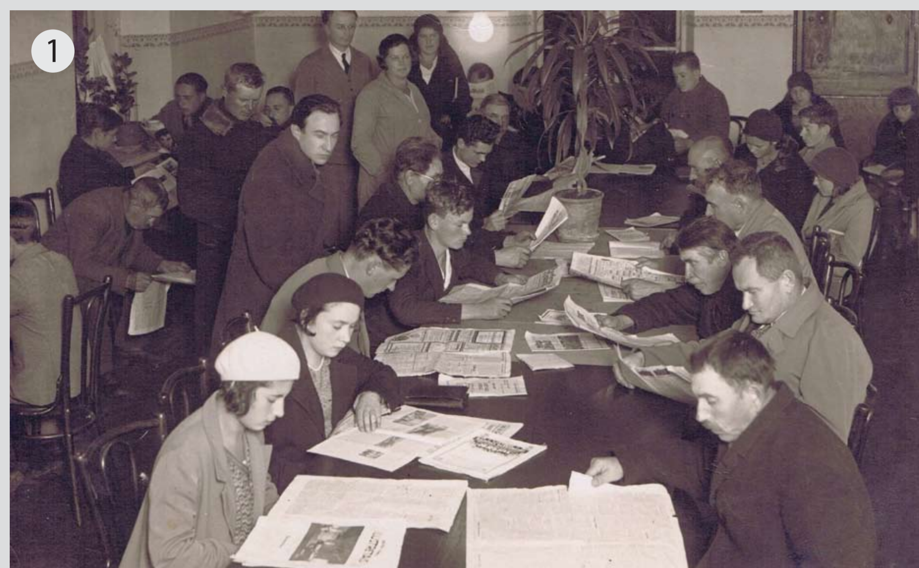
1919. gadā atvērta lasītava darbojas 7 dienas nedēļā un to apkalpoja brīvprātīgie palīgi

Turpinot attīstību, tika izveidota Ventspils pilsētas Centrālās zinātniskās bibliotēkas mūzikas un nošu literatūras lasītava . Tā bija otra tāda veida lasītava visā republikā 13