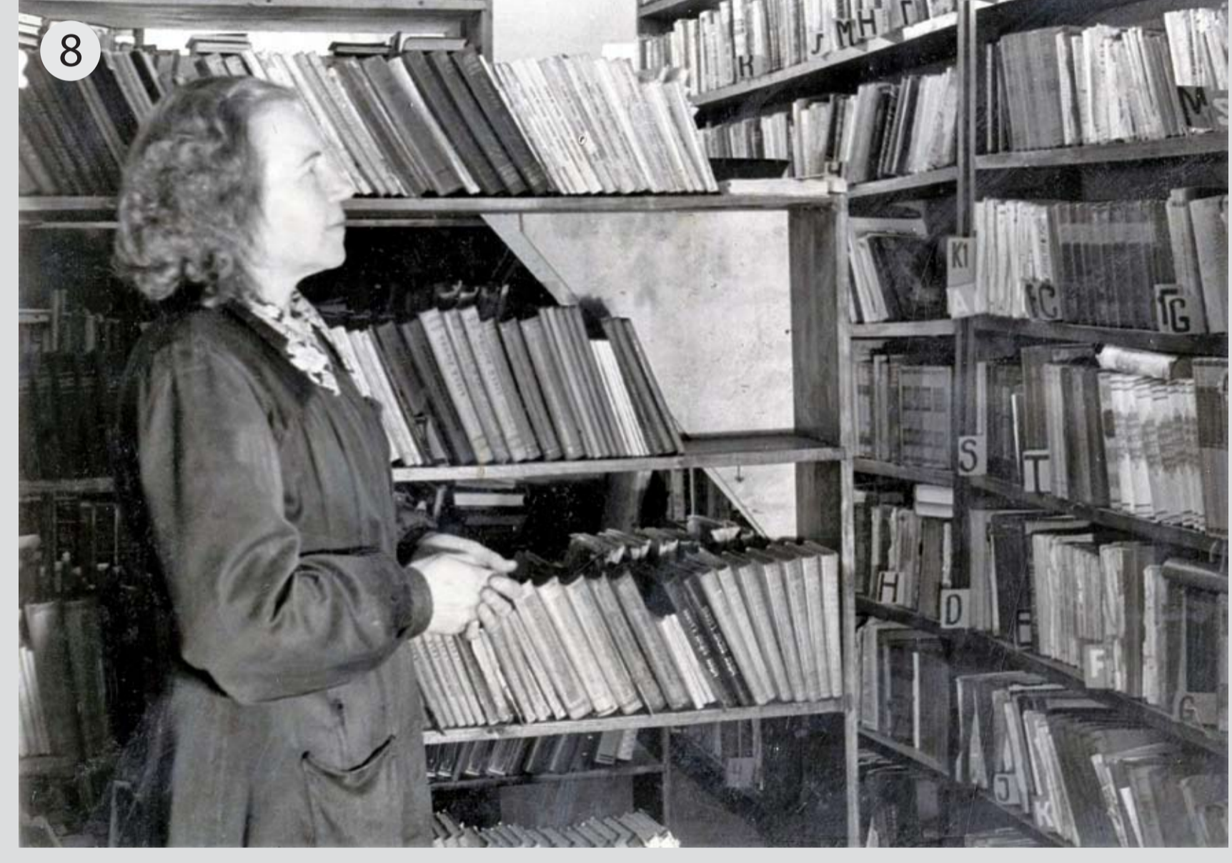
1948. gadā dibinātā Pārventas bibliotēkā sākumā bija tikai 150 grāmatu, kas glabājās vienā mazā skapīti